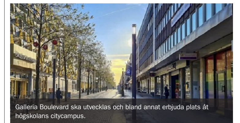
Galleria Boulevard ska utvecklas och bland annat erbjuda plats åt högskolans citycampus.