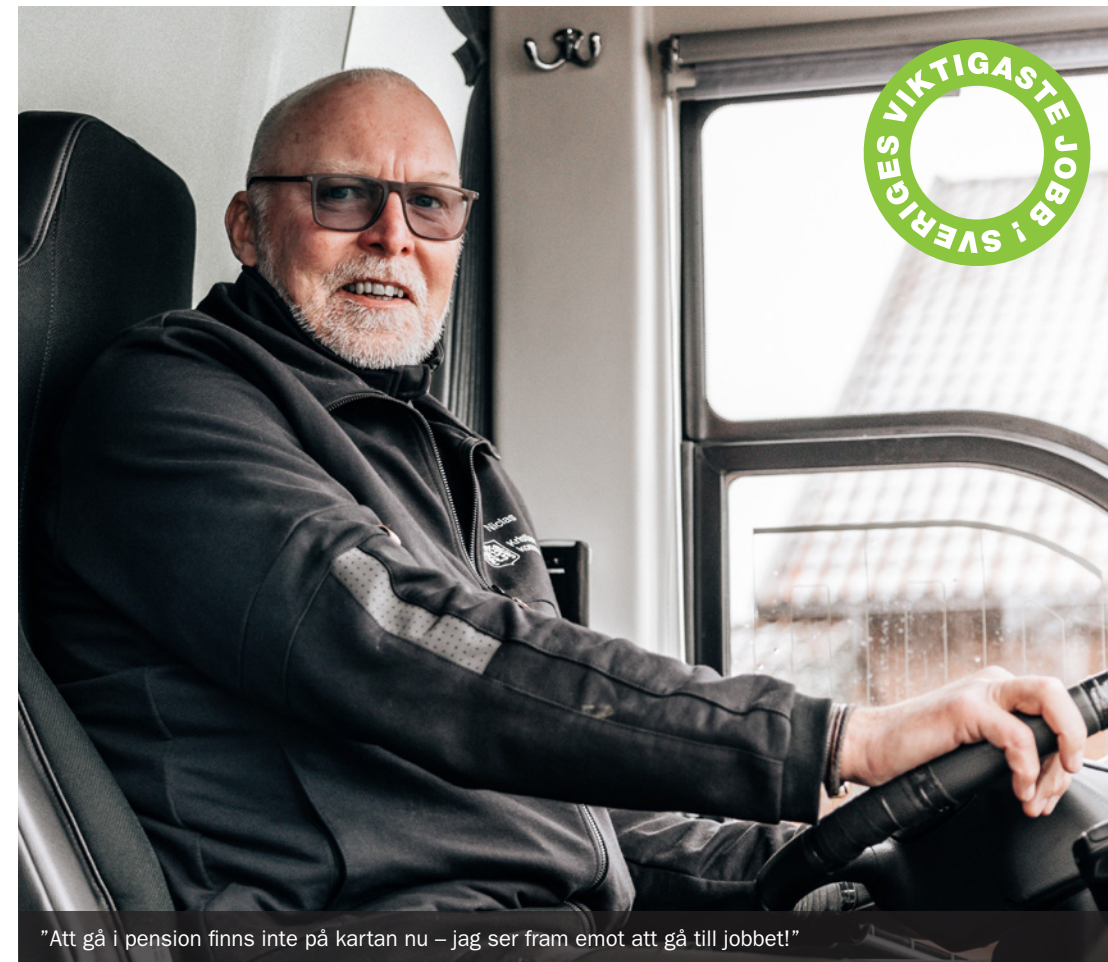
"Att gå i pension finns inte på kartan nu – jag ser fram emot att gå till jobbet!"

Kulturhuset Barbacka har kurser inom flera olika dansstilar och nivåer för åldrarna 4–20 år. Anmälan till vårens kurser öppnar 8 januari. Läs mer på www.barbacka.se