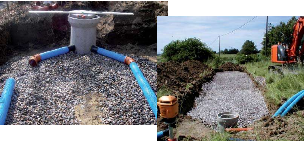
Slamavskiljare och utläggning av rör för infiltration.

När marklagren består av täta material kan en markbädd vara en alternativ lösning. I en markbädd filtreras och renas avloppsvattnet i ett uppbyggt grus- och sandlager. Därefter samlas vattnet upp i botten av diket. Därifrån leds det renade avloppsvattnet bort till ett lämpligt vattendrag eller vattenförande dike.