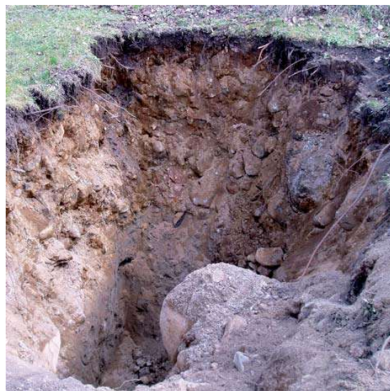
Provgropen visar jordmån och grundvattennivå.

att grundvattenytan ska hinna ställa in sig. Förhoppningsvis är jordarten lämplig och grundvattennivån acceptabel så att en infiltrationsanläggning går att bygga.