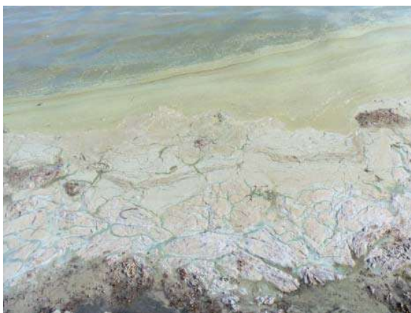
Orenat avloppsvatten bidrar till problem med algbloomning.

Avloppsvatten innehåller bland annat näringsämnen, organiskt material, bakterier och virus. Utsläpp av orenat avloppsvatten leder till övergödning av våra vattendrag, sjöar och Östersjön. I förlängningen innebär det till exempel problem med algbloomning och syrebrist på havsbottnar. Även vårt dricksvatten kan förstöras om det förorenas av avloppsvatten. Höga halter av näringsämnet nitrat i dricksvatten är skadligt, speciellt för små barn. Bakterier och virus kan också förorena grund-, dricks- och badvatten.