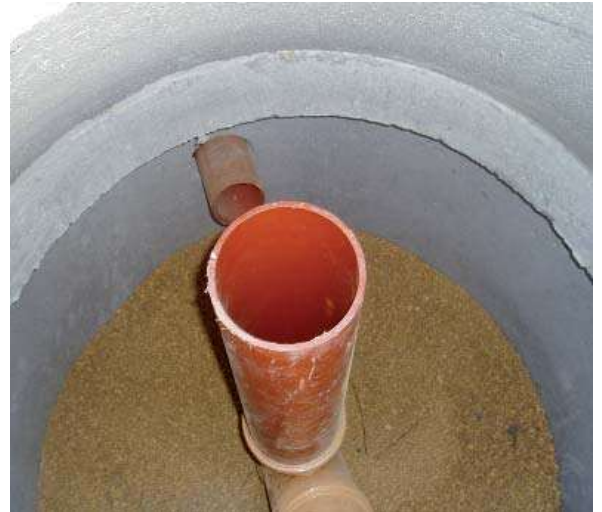
Fosforfälla med fosforbindande material.

Filterbädd med fosforbindande material är en vidareutveckling av markbädden. Förutom rening av organiskt material och smittämnen sker en kraftig rening av fosfor.