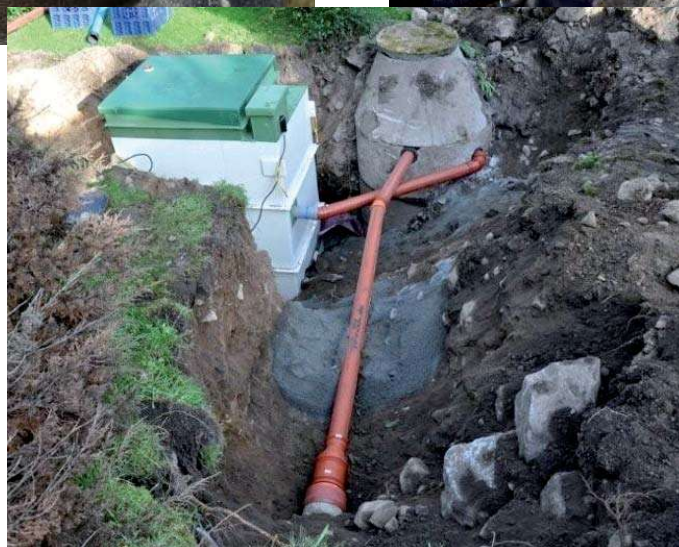
Exempel på minireningsverk.