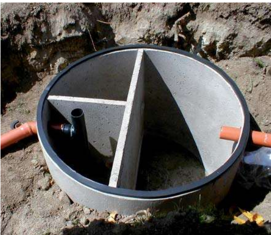
Trekammarbrunn för slamavskiljning.

I detta steget finns en slamavskiljare som separerar avloppsvattnets grövre partiklar från vattnet. Förbehandlingen kan kompletteras med urinseparering eller kemisk fällning.