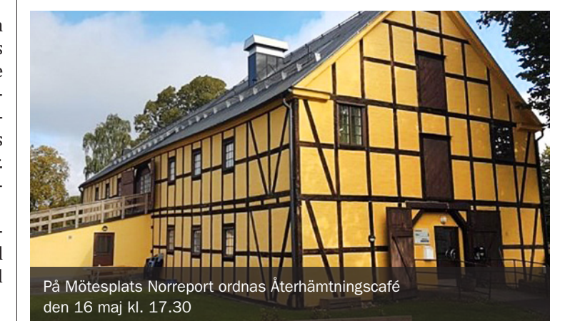
På Mötesplats Norreport ordnas Återhämtningscafé den 16 maj kl. 17.30

Läs mer om återhämtning på www.aterhamtningsguiden.se