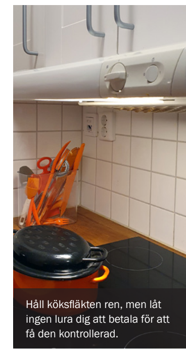
Håll köksfläkten ren, men låt ingen lura dig att betala för att få den kontrollerad.

du ha systemet kontrollerat är det tryggast att själv ta kontakt med en välkänd ventilationsfirma eller med det lokala sötningbolaget.