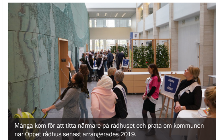
Många kom för att titta närmare på rådhuset och prata om kommunen när Öppet rådhus senast arrangerades 2019.

Oavsett vilken kommunal verksamhet du har frågor kring, kan du att hitta svar i Rådhus Skåne på skyltsöndagen.