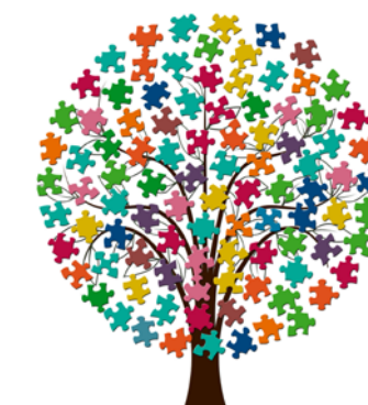
Trädet är symbol för En bra plats