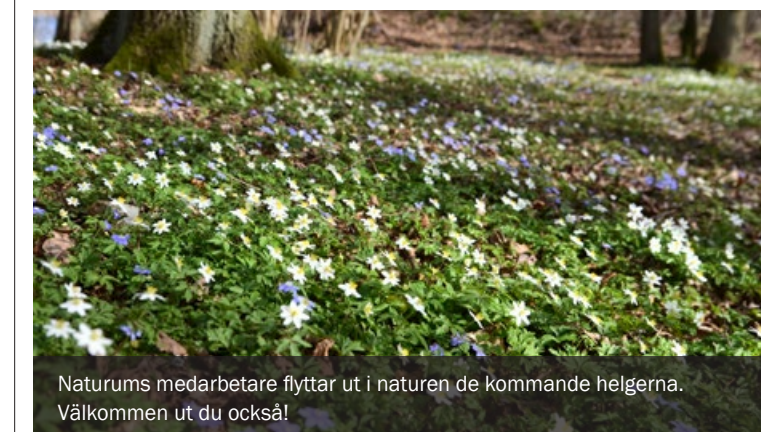
Naturums medarbetare flyttar ut i naturen de kommande helgerna. Välkommen ut du också!

Lördag-söndag 24–25 april möter du naturum på Norra Lingenåset. På våren är marken är täckt av sippor och luftfulla, fågelsång. Följ nya sagostigen om vatten som tappat bort sin älsklingsblomma! Passa på att utmana en kompis med tipsrundan.