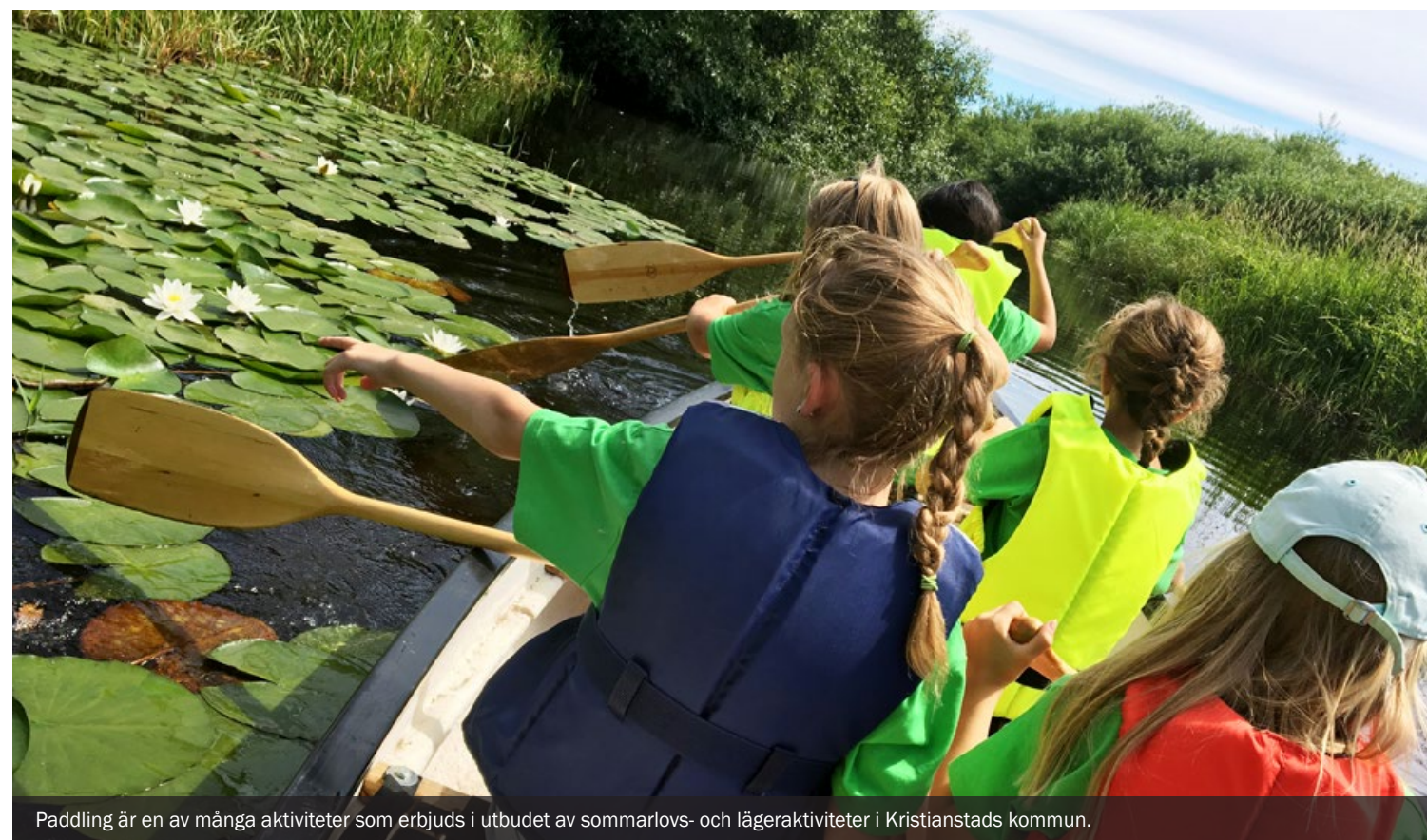
Paddling är en av många aktiviteter som erbjuds i utbudet av sommarlovs- och lägeraktiviteter i Kristianstads kommun.