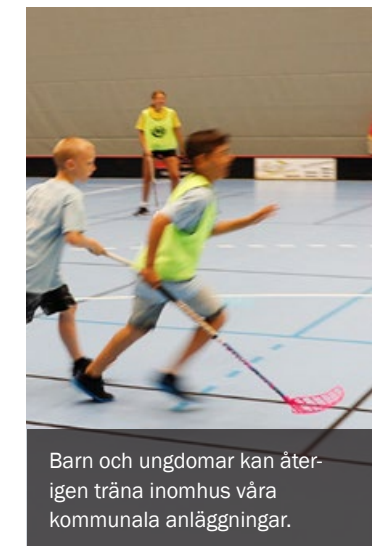
Barn och ungdomar kan återigen träna inomhus på kommunala anläggningar.

Nya besked kan komma snabbt. Uppdaterad information finns alltid på kristianstad.se/paverkancorona