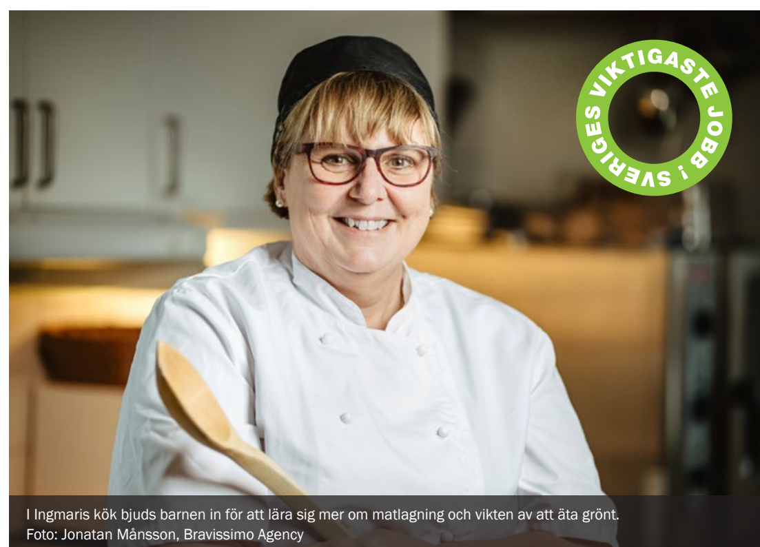
I Ingmaris kök bjuds barnen in för att lära sig mer om matlagning och vikten av att äta grönt.

PedagogHund är ett varumärke från Svenska pedagoghundsinstitutet och att ha hund i skolan är ett relativt nytt koncept i Sverige. De som läser utbildningen måste ha en lärarlegitimation för att kunna utbilda sina hundar. Idag finns ungefär 200 arbetande hundar i den svenska skolan.