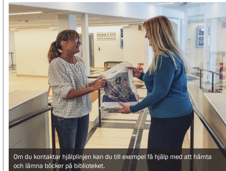
Om du kontaktar hjälplinjen kan du till exempel få hjälp med att hämta och lämna böcker på biblioteket.

restaurang eller hämta böcker på biblioteket. Du kan också ringa och prata en stund, ställa frågor eller få stöd om du är orolig. Kommunen samarbetar med flera organisationer och har volontärer som är beredda att hjälpa till. Tveka inte att höra av dig om du behöver hjälp eller någon att prata med. Hjälplinjen är öppen på vardagar mellan klockan 8 och 16 på telefon 044-13 20 99. Du kan också läsa mer och boka hjälp via e-tjänsten som du hittar på www.kristianstad.se/hjalplinjen .