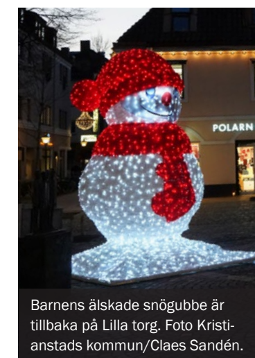
Barnens älskade snögubbe är tillbaka på Lilla torg.

Söndagens julslytning är också värd en promenad. Ingen