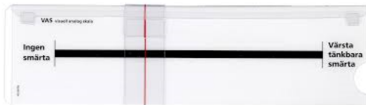
VAS – Visuell Analog Skala

Val av skattningsinstrument kan variera beroende på patienter. Det är viktigt att komma ihåg att en persons egen uppfattning av sin smärta alltid ska respekteras i första hand. Då bör ett självskattningsinstrument användas, exempelvis den Visuella Analoga Skalan (VAS) där antalet mm mäts på den 100 millimeter långa skalan.