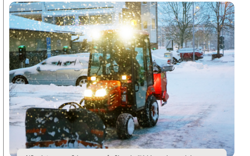
När vinterns snö kommer så röjer vi alltid i en viss ordning.