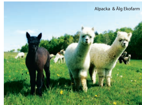
Alpacka & Aig Ekofarm

Naturum Vattenriket Naturum Vattenriket nestles in the reeds in the middle of town, offering exhibitions, activities and a view of the town and the wet meadows. The Optrerx simulator takes you on a virtual journey through Kristianstads Vattenrike – providing inspiration to continue to one of the 22 visitor sites in the countryside.