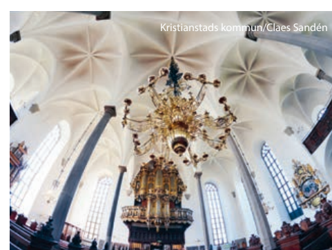
Kristianstads kommun/Glenn Sandén

FCT Köpcenter Take a shopping safari and get low prices that attract visitors from far and wide. Find bargains in everything from fishing tackle to fine paints, clothes and toys.