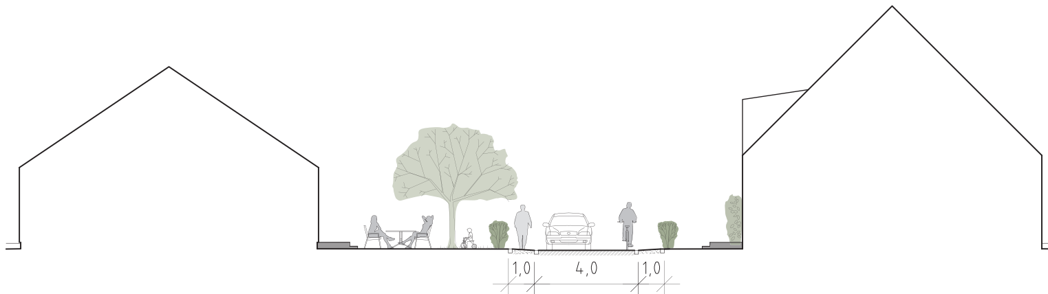
Sektion A-A genom huvudgata