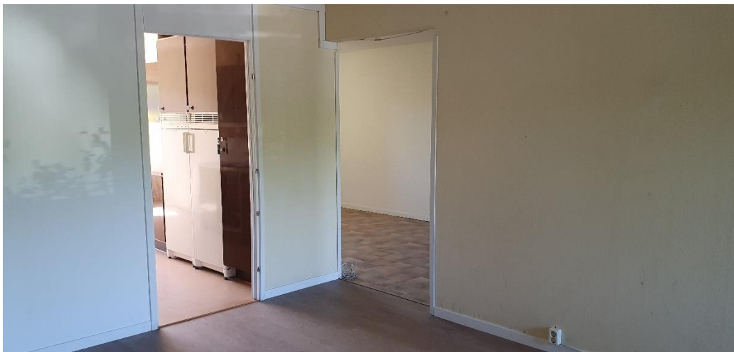
Vardagsrum med anslutning till kök och rum 2