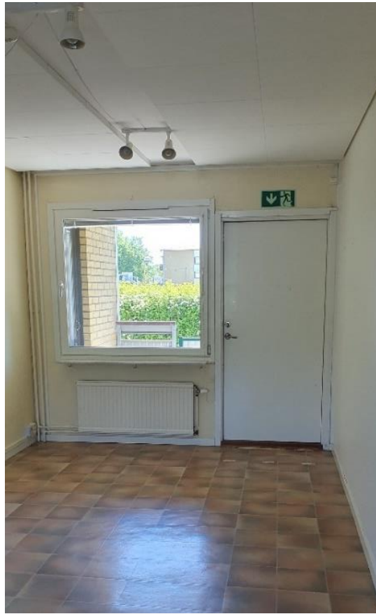
Rum 2 med utgång till balkong