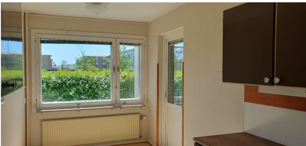
Kök med utgång till balkong