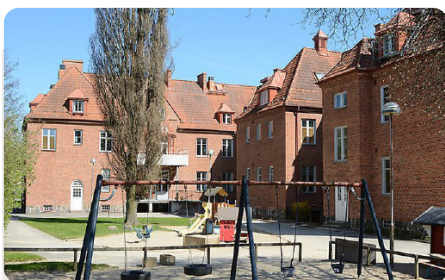
Ängsgårdens förskola vid CSK var tidigare Kristianstads stads fattigvårdsinrättning.

I samband med 1956 års lag om socialhjälp ersattes fattigvårdsstyrelsen med socialnämnd. Omsorgsnämnden bildades först 1992 när kommunerna tog över ansvaret för bland annat äldreomsorgen.