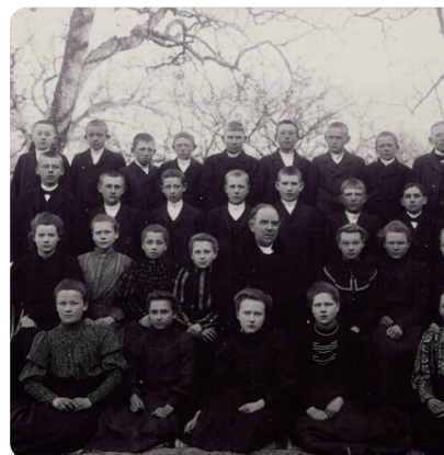
Klassfoto från Ugerups folkskola 1899. Namn på elever och lärare är okänt. Fotot har donerats till kommunarkivet av en privatperson.

Man ser ett tydligt mönster i vilka arkiv som finns sparade hos kommunarkiven runt om i landet. Här följer exempel på olika typer av arkiv som finns bevarade för all framtid hos kommunerna.