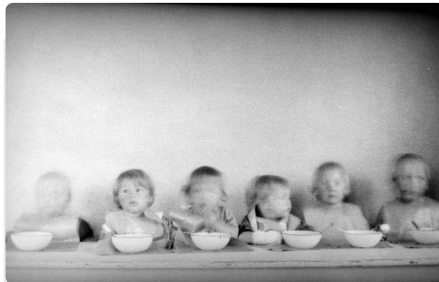
Under slutet av 1800-talet började människor gå samman för att hjälpa barn som hade det svårt. 1910 bildades Kristianstads Mjölkdroppen med syfte att förbättra barns hälsa genom att erbjuda gratis modersmjölksersättning och läkarbesök.

Vi gör alltid en sekretessprövning innan handlingar lämnas ut från de sociala arkiven. Sekretess råder för information som är 70 år och yngre. Uppgifter rörande dig själv får du alltid ta del av. Innehåller handlingarna däremot uppgifter om andra personer än dig själv, kan dessa uppgifter sekretessbeläggas innan handlingen lämnas ut.