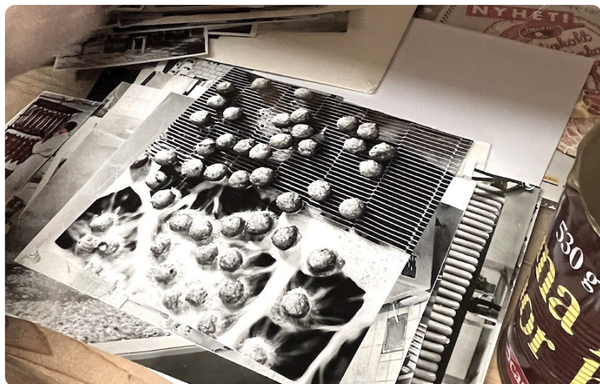
Köttbullar i drivor! Foto från när kommunarkivet hjälpte till att packa ihop KBS/Scans arkiv.

Offentlighetsprincipen gäller inte för privata aktörer som till exempel bolag och föreningar. Det är naturligtvis viktigt att dessa arkiv bevaras även om det inte är tvingande i lag. Våra enskilda arkiv utgör en viktig pusselbit i vårt kollektiva minne.