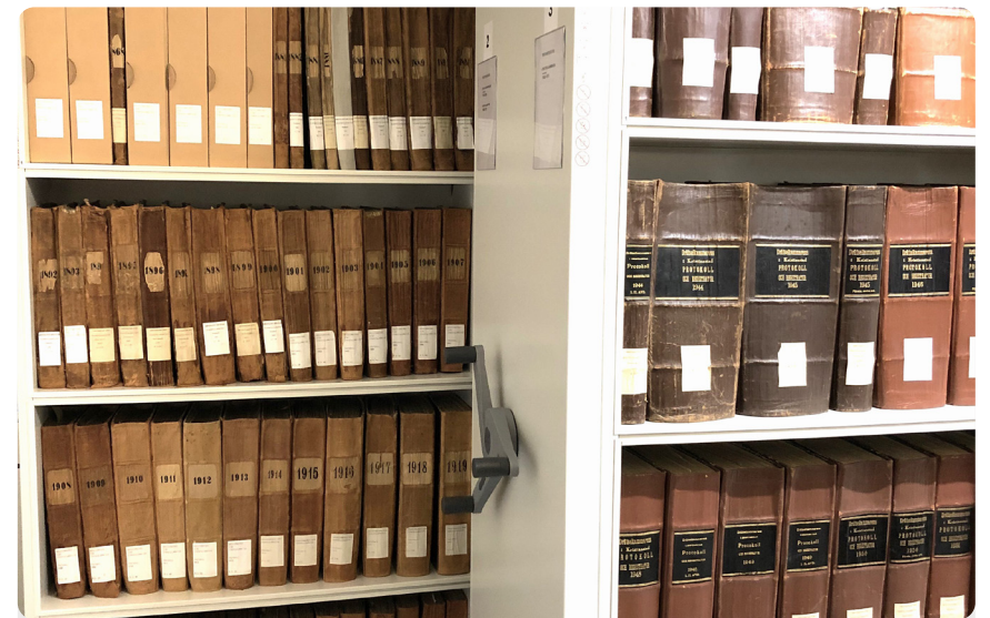
Rad efter rad med protokoll från stadsfullmäktige och drätselkammaren i dåvarande kommunen Kristianstads stad (1863-1971). Drätselkammaren var föregångaren till dagens kommunstyrelse.

Oftast är det något som leder till att man behöver ta ett beslut, till exempel att det kommer in en ansökan. Handlingen som skickas in till kommunen ingår i arkivet. Andra handlingar som man kan hitta i ett arkiv är utredningar och tjänsteskrivelser kopplade till att ett beslut tas.