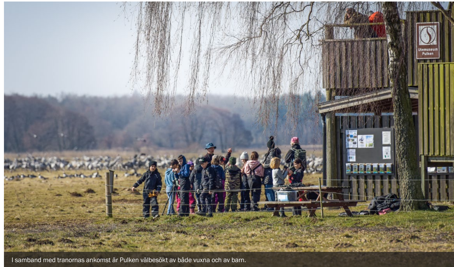
I samband med tranornas ankomst är Pulken välbesökt av både vuxna och av barn.