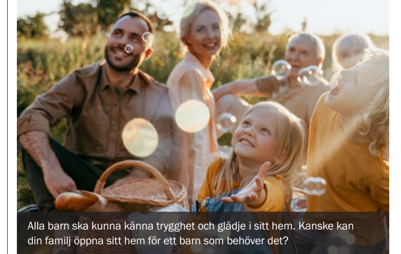
Alla barn ska kunna känna trygghet och glädje i sitt hem. Kanske kan din familj öppna sitt hem för ett barn som behöver det?