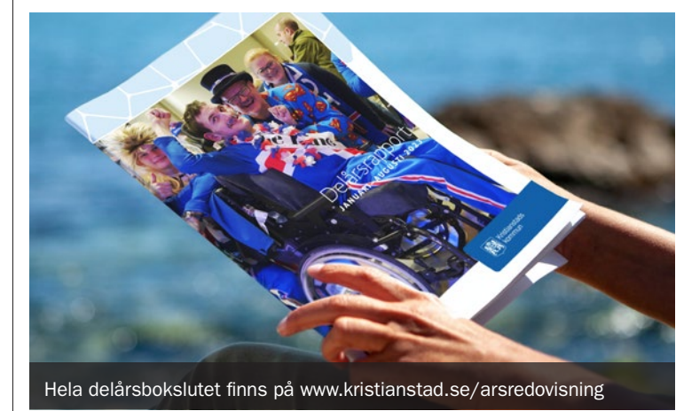
Hela delårsboksutet finns på www.kristianstad.se/arsredovisning

Det förbättrade årsresultatet beror främst på att skatteintäkterna, men även statsbidragen, blev högre än väntat.