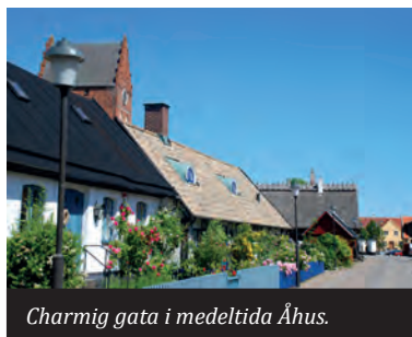
Charmig gata i medeltida Åhus.

Turen följer Sydostledens skyltning från Kristianstad söderut. Du passerar Hammarsjön, Ekenabben, Viby och Rinkaby ner mot Åhus.