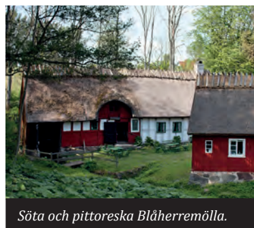
Söta och pittoreska Blåherremölla.

Från Åhus och söderut finns det gott om möjlighet till svalkande bad då havet aldrig är långt borta. Fortsätt till Juleboda och stanna gärna till vid Blåherremölla innan det är dags att svänga mot Maglehem och fortsätta tillbaka mot Kristianstad. På vägen passerar du Degeberga. Här finns en väldigt vacker hembygdspark och Forsakar, ett