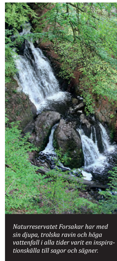
Naturreservatet Forsakar har med sin djupa, trolska ravin och höga vattenfall i alla tider varit en inspirationskälla till sagor och sägner.