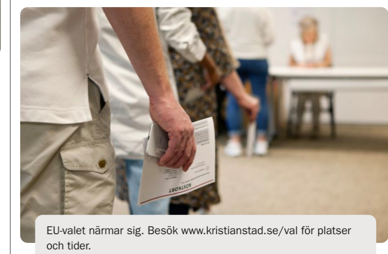
EU-valet närmar sig. Besök www.kristianstad.se/val för platser och tider.

Allt du behöver vet om hur och var du röstar i EU-valet, www.kristianstad.se/val