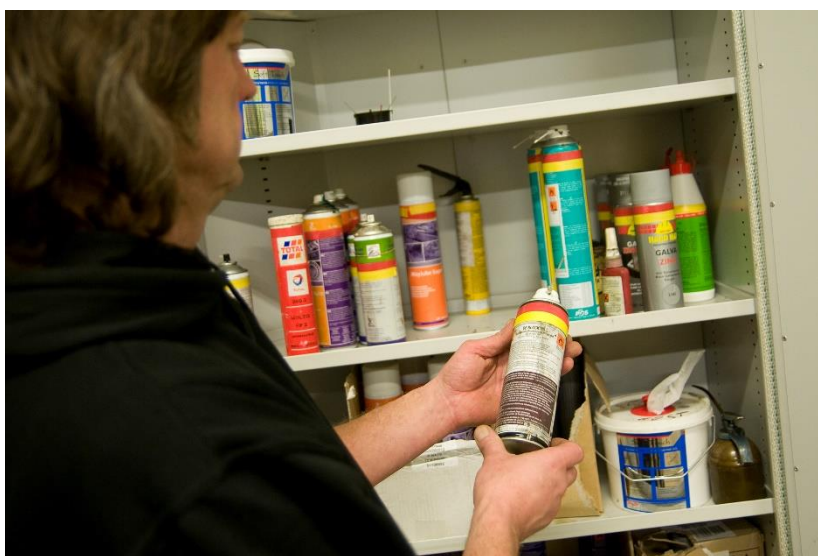
Inventera ert kemikalieförråd.