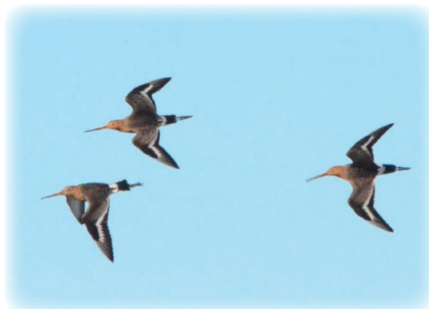
Rödspovarnas vita vingband syns tydligt i flykten.

Rödspoven är utsedd till en av Kristianstads kommuns ansvarsarter på grund av dess akut hotade status. Ansvarsarter är hotade arter som är karakteristiska för kommunen. Totalt har 46 arter blivit utsedda till ansvarsarter i kommunen.