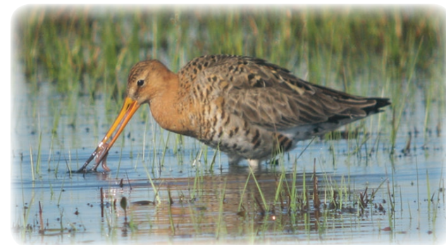
Rödspov som söker efter mat.

Inom ramen för Kristianstads Vattenrike pågår sedan många år arbete med att restaurera och bevara de strandängar som är viktiga häckningsmiljöer för rödspoven. Till en början ledde det till att rödspoven ökade i antal längs de nedre delarna av Helgeå. De senaste åren har trenden vänt och nu finns rödspoven bara kvar på ett par lokaler vid Helgeå. Minskningen är sannolikt en kombination av flera orsaker, bland annat den kraftiga sommaröversvämningen 2007. Det behövs mer kunskap för att kunna vända trenden.