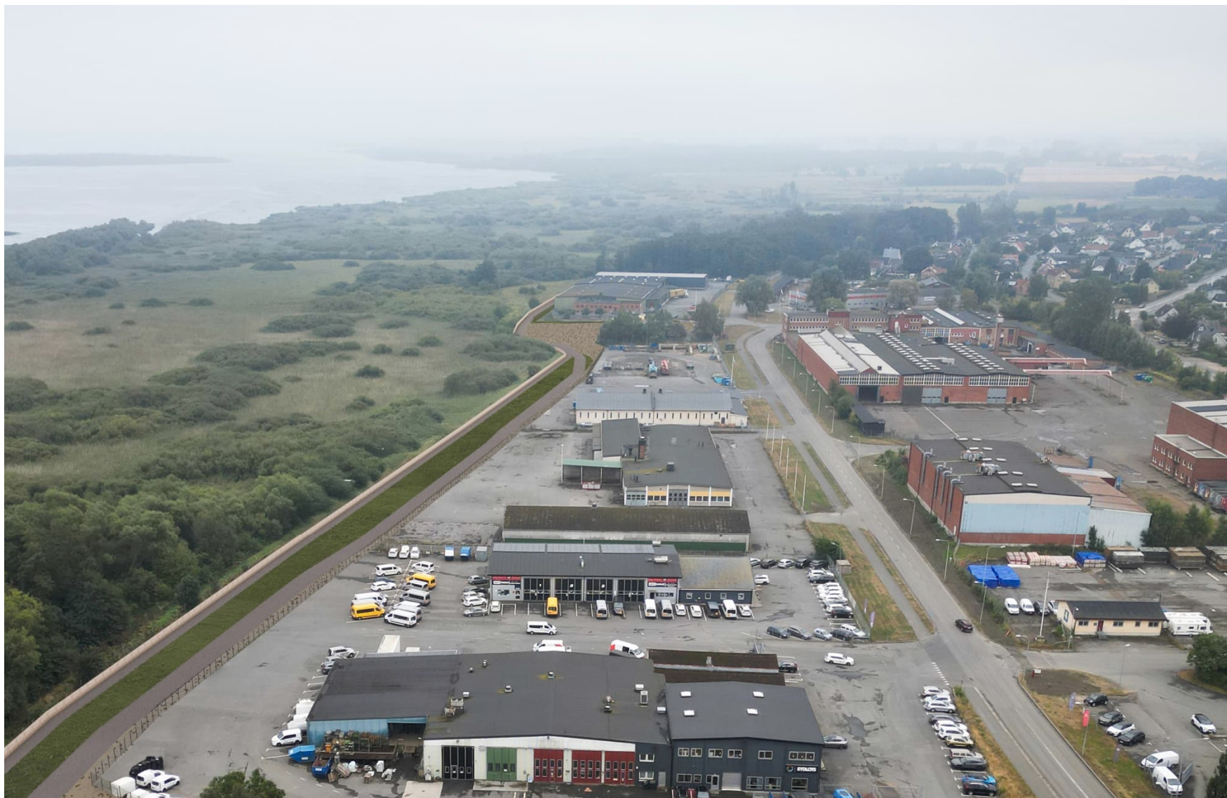
Södra Hedentorpsvallen. Fågelperspektiv, från strax söder om E22 och söderut. Vallsträckningen framgår mellan industriverksamheter och naturmark.