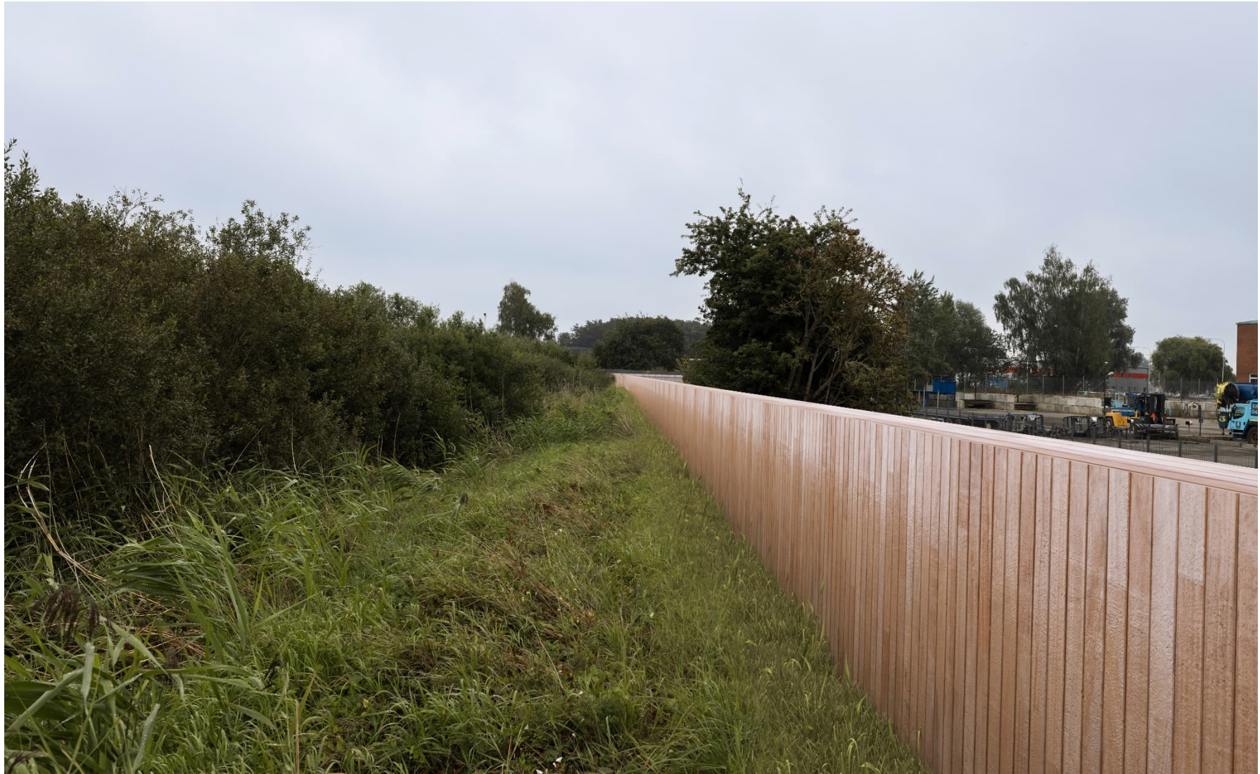
Södra Hedentorpsvallen. Den träbeklädda sponten sedd från östra sidan, som ger en avskärmning mellan industriverksamheterna och naturmiljön.