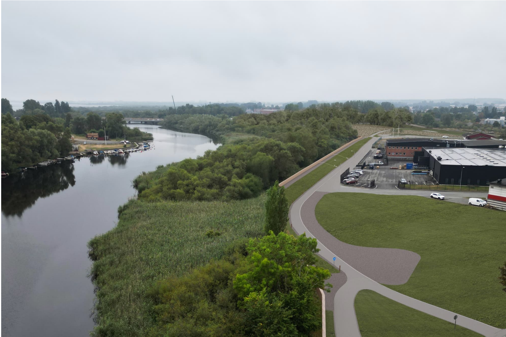
Norra Hedentorpsvallen. Fågelperspektiv, sedd från Långebro och söderut.