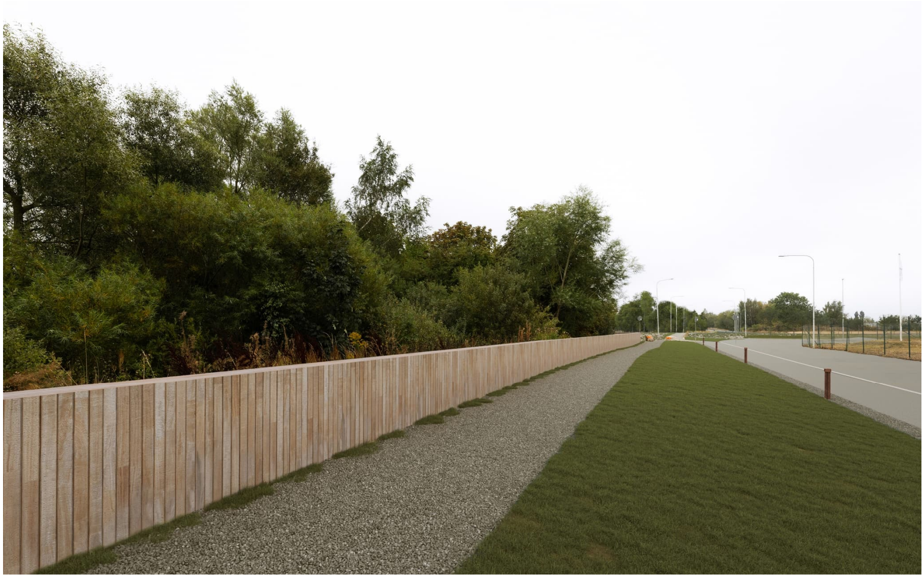
Norra Hedentorpsvallen, del av sträckan längs den nuvarande Hedentorpsvägen. Träbeklädd spont, GC-väg, belysningspollare och serviceväg till höger.