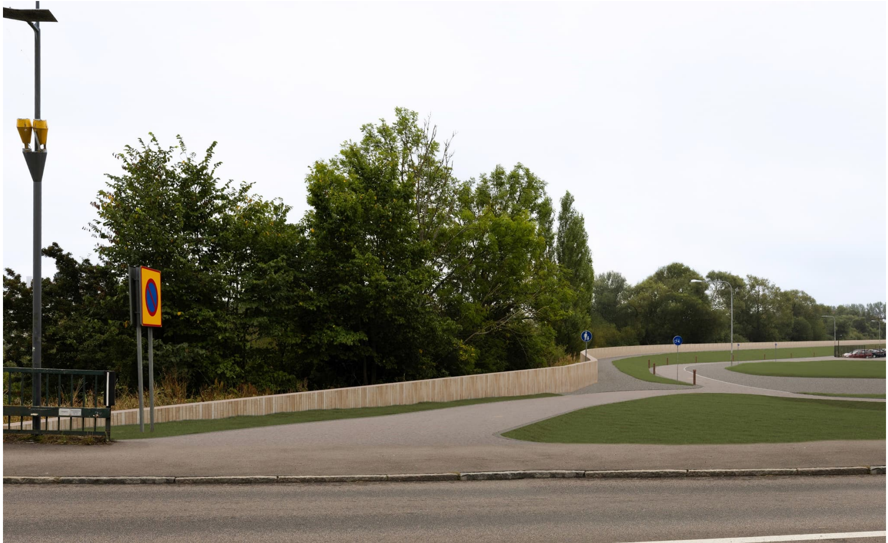
Norra Hedentorpsvallen. Vy från Långebro mot söder. På illustrationen ses den träbeklädda sponten, låga belysningspollare, gång- och cykelvägen samt serviceväg till höger.