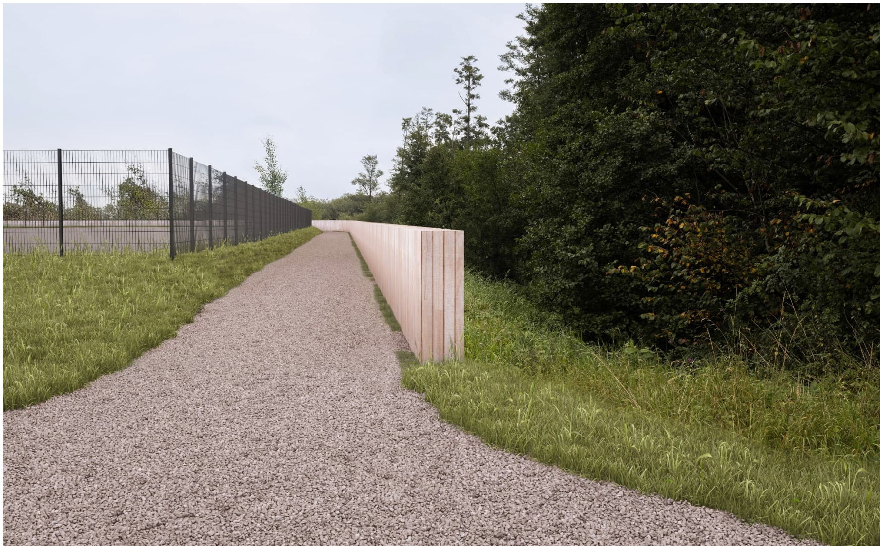
Södra Hedentorpsvallen. Vallsträckningens avslut mot Alevägen i söder. Industrifastigheter till vänster i bild, alsumpskog till höger. På bilden framgår den träbeklädda sponten samt GC-väg.