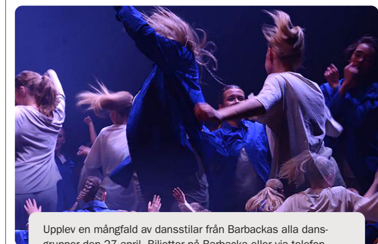
Upplev en mångfald av dansstilar från Barbackas alla dansgrupper den 27 april. Biljetter på Barbacka eller via telefon.

Biljetter köps på Barbacka eller bokas på telefon 044-13 56 50 under kulturhusets öppettider.