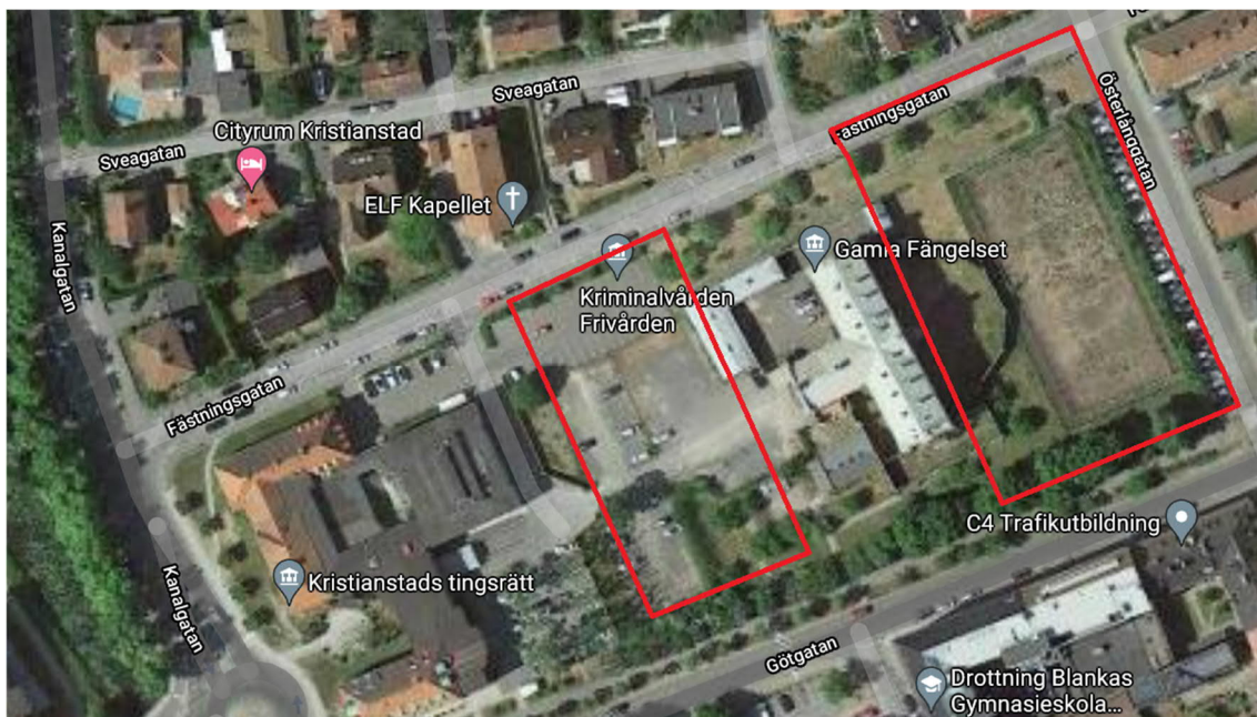
Figur 2. Undersökningsområdena markerade med röda polygoner.

Kompletterande undersökning kommer att krävas i detaljprojekteringskedet när exakt placering och utformning av byggnader och övriga anläggningar är fastställda samt för att få mer detaljerad kunskap om föroreningsituationen i jord.