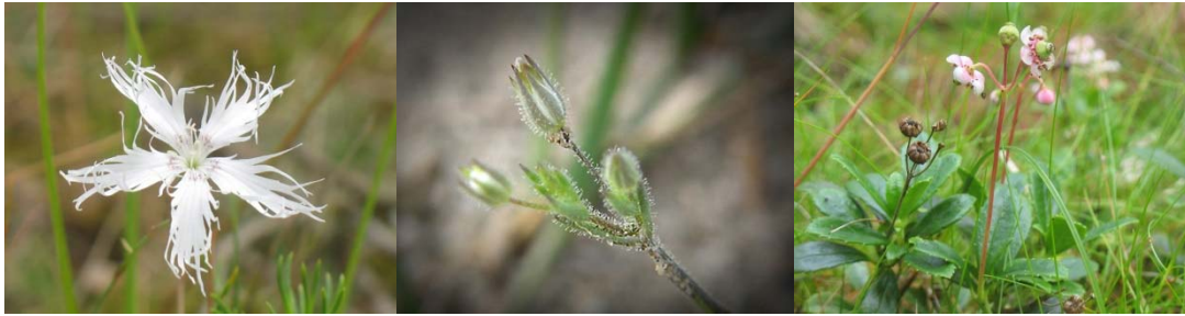
Foto: Christer Neideman, Sländan Gith Hansson, Sländan Christer Neideman, Sländan