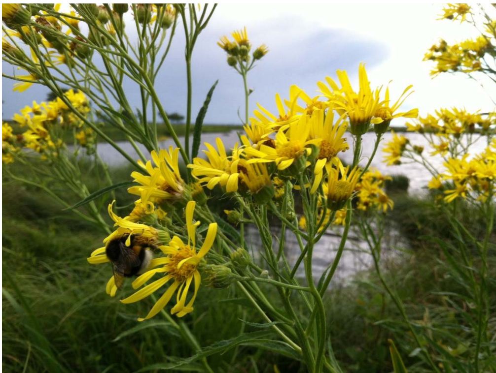
Gullstånds har sin huvudsakliga utbredning inom norden i Kristianstads kommun.

Artdatabanken genom Sveriges Lantbruksuniversitet tar tillsammans med forskare och experter fram en lista över våra hotade arter, rödlistan. Kristianstads kommun har ett mycket stort antal rödlistade arter. Flera av dessa arter är specifikt knutna till området. Ett sådant exempel är gullstånds Senecio Paludosus som har sin huvudsakliga utbredning inom norden i Kristianstads kommun. Hotade arter som är knutna till kommunen faller under begreppet ansvarsarter. Detta innebär att kommunen hyser ett speciellt ansvar för bevarandet av dessa arter.