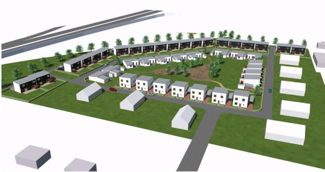
Figur 2. Illustration över planerade bostäder inom Revisorn 8.