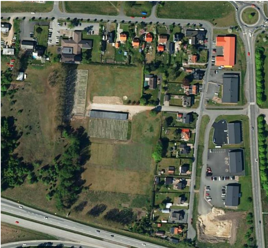
Figur 1. Aktuellt undersökningsområde.

Samtliga nivåer i denna rapport är angivna i RH2000.