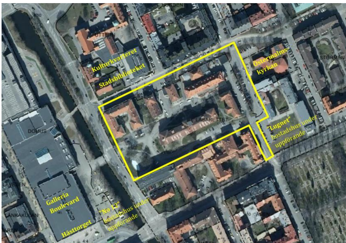
Figur 1: Planområdet markerat med gul linje

Miljökonsekvensbeskrivningen omfattar samma geografiska område som planförslaget, vilket framgår av Figur 1. För vissa aspekter behöver dock miljökonsekvensbeskrivningen ha ett vidare perspektiv. Det bedöms i detta fall gälla kulturmiljö där påverkan kan sträcka sig utanför planområdet.