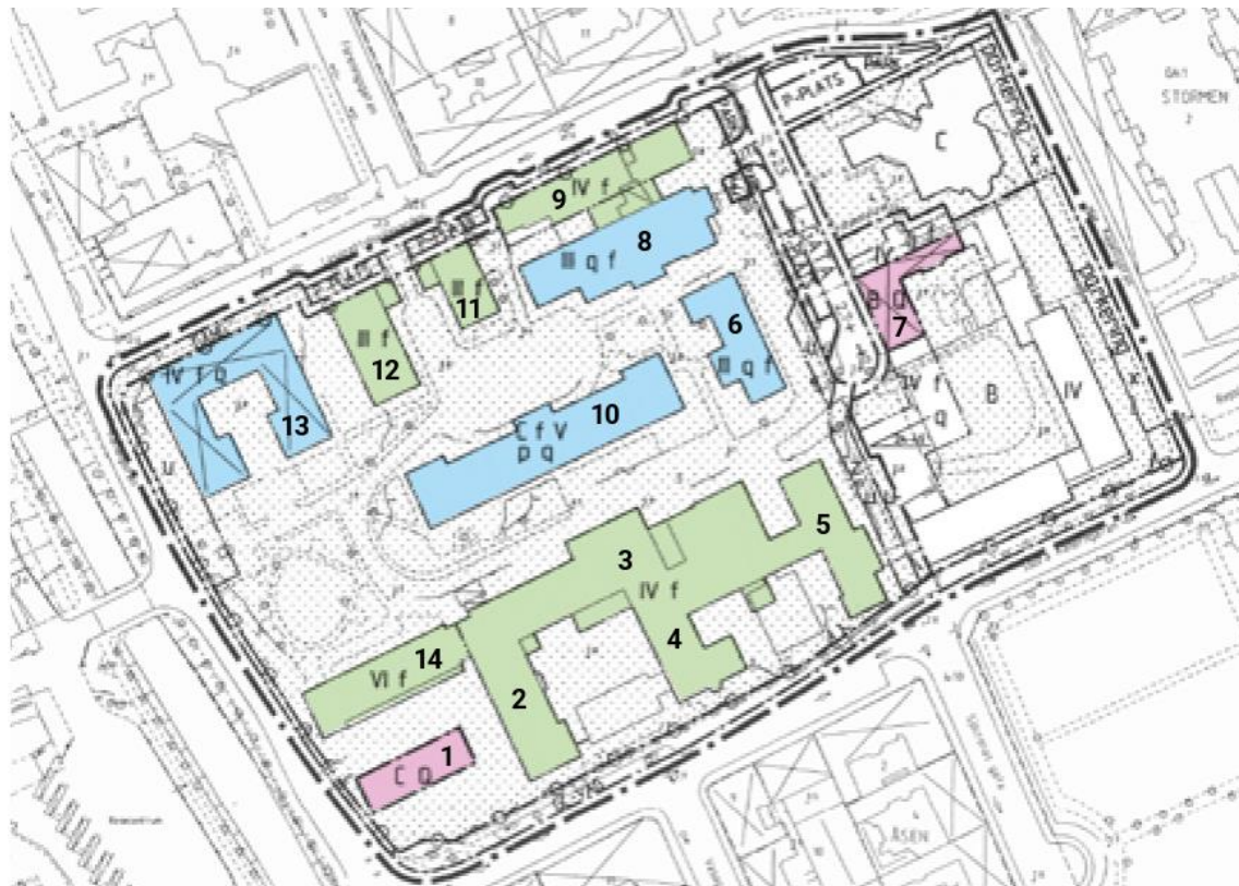
Figur 4: Befintlig situationsplan över kvarterets byggnader.

[2] Kvinnokliniken, [3] Röntgen & Ögon, [4] Kirurgisk paviljong 1920, [5] Kirurgisk paviljong 1915, [9] Pannhus, [11] Familjebostaden 1937, [12] Personalbostäder 1928 och [14] Barnklinik 1964.